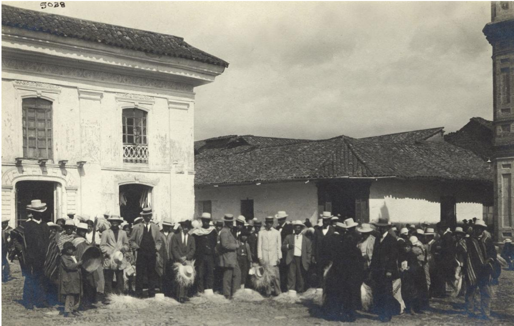
Fig4: Mercado de Paja Toquilla en la Plaza de Santo Domingo durante los primeros años del siglo XX, AHF 5028.

Es necesario conocer las actividades históricamente realizadas en ciertas zonas de la ciudad de tal forma que las aún existentes puedan ser preservadas e incentivadas. Este conocimiento también puede permitir la generación de políticas de preservación de actividades artesanales tradicionales evitando el desplazamiento de las mismas para generar espacios meramente turísticos faltos de sentido.