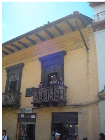
Fig. 1: No es una mera coincidencia la proliferación de Balcones en la Calle Bolívar, como respuesta arquitectónica al patrimonio inmaterial dado por las procesiones y desfiles por esta arteria de la ciudad. Fotografías: autor, diciembre 2009

Las ciudades son entidades vivas en las que se desarrollan diversas actividades, las mismas que a lo largo del tiempo han provisto de un valor especial a los espacios donde tienen lugar. Los rastros de estas actividades pueden o no estar presentes en la ciudad durante todo el año pero no dejan de estar presentes en el imaginario de la ciudad, dando valor y significado a varios espacios.