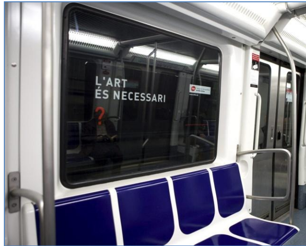
[Fig. 1] Alfredo Jaar. Qüestions, qüestions . 2008

social?, ¿el intelectual es inútil? Alfredo Jaar, empleando las mismas tácticas que las campañas publicitarias, distribuyó 90.000 postales y colgó 22.500 carteles y bandas publicitarias en diversos museos e instituciones artísticas, además de ubicarlos en los autobuses y el metro. Asimismo, proyectó las mismas cuestiones en anuncios en televisión, cine e internet.