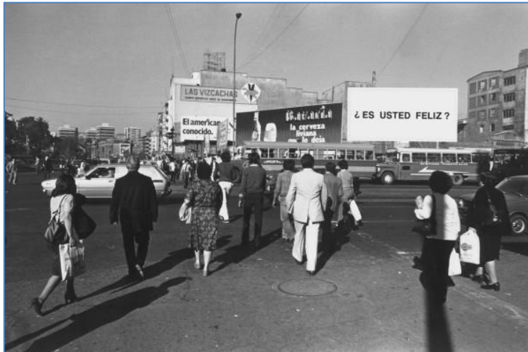
[Fig. 2] Alfredo Jaar, Estudios sobre la felicidad .1981.

Ai Weiwei, uno de los artistas más emblemáticos y polémicos tanto en China como dentro del escenario internacional, fundamenta varias de sus obras en la participación, utilizando para ello la potencialidad de internet para llevar a cabo producciones colaborativas.