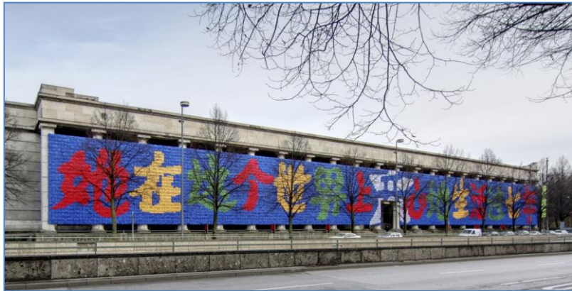
[Fig. 3]. Ai Weiwei, Remembering , 2009

En la exposición retrospectiva So Sorry (de octubre de 2009 a enero de 2010, en Múnich) presentó la instalación Remembering [Fig. 3]. El título de la muestra alude a la expresión empleada por los representantes gubernamentales para lamentar las posibles negligencias cometidas y las pérdidas humanas consecuencia del terremoto de Sichuan, en 2008. Como respuesta a tal situación Ai Weiwei montó la obra Remembering , en la fachada del Haus der Kunst, a partir de nueve mil mochilas escolares dispuestas de manera que se podía leer la siguiente frase en mandarín: “Ella vivió felizmente siete años en este mundo”. Dicha sentencia procede de la exclamación de una madre cuya hija falleció en el seísmo. Ai Weiwei, en esta propuesta, pretende llamar la atención sobre la desgracia sucedida, recordando que justamente los centros escolares fueron parte de las construcciones más dañadas en el terremoto. Su activa investigación cuestiona abiertamente los precarios materiales de construcción utilizados en las instituciones educativas que se desmoronaron durante el desastre natural y provocaron la muerte de miles de niños. El artista publicó en su blog la lista –con más de 5000 nombres– de todos los niños fallecidos 3 . La investigación fue realizada gracias a la ayuda de voluntarios y Ai Weiwei recurrió a internet para comunicar, recordar y denunciar lo acontecido. Ai Weiwei explica: